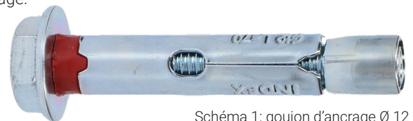
Schéma 1: goujon d'ancrage Ø 12

Si vous souhaitez ranger des objets de valeurs avec une dimension inférieure à 15 mm dans votre coffre-fort, il sera à conseiller de les conserver dans un emballage plus grand, pour avoir plus de sécurité. Ainsi vous éviterez qu'un cambrioleur perce un trou dans le paroi de votre coffre-fort pour voler vos biens avec par exemple un aspirateur.