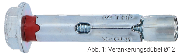
Abb. 1: Verankerungsdübel Ø12

Wenn Sie Wertsachen kleiner als 15 mm im Tresor aufbewahren möchten, empfehlen wir Ihnen, diese aus Sicherheitsgründen in einer größeren Verpackung aufzubewahren. So wird verhindert, dass Einbrecher kleine Wertsachen aus dem Tresor z.B. mit Hilfe eines Staubsaugers stehlen, wenn sie ein Loch bohren.