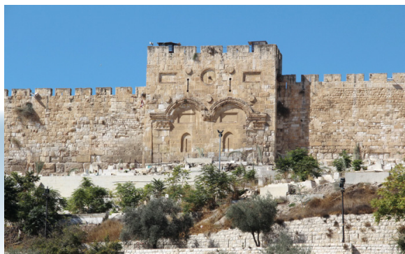
De dichtgemetselde Gouden Poort (Golden Gate) van Jeruzalem