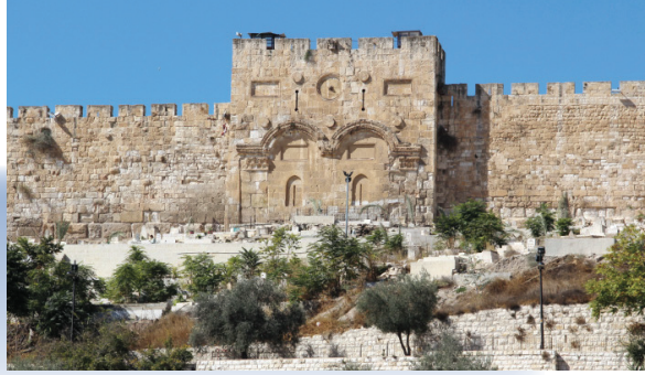
De dichtgemetselde Gouden Poort (Golden Gate) van Jeruzalem