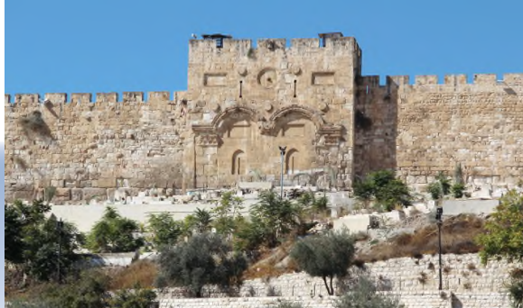
De dichtgemetselde Gouden Poort (Golden Gate) van Jeruzalem