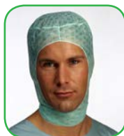
Cagoule avec bande absorbante, All