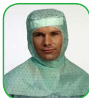
Cagoule avec couverture des épaules, All Pro