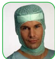
Cagoule avec bande absorbante, All