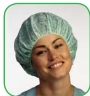
Charlotte ronde à élastique, Flott