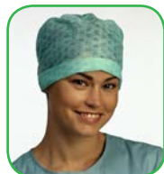
Coiffe à nouer, Chic