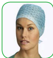
Coiffe chirurgicale, Theatre