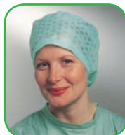
Coiffe élastiquée aérée, Kosack