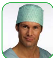
Calot, Theatre Elast