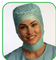
Cagoule, All Lady