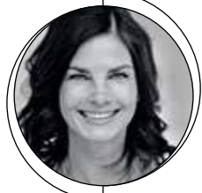
ONDER REDACTIE VAN ANITA VLAAR