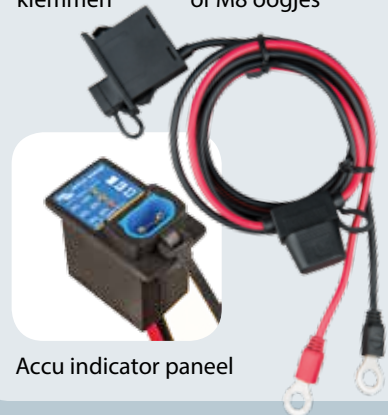
Accu indicator paneel