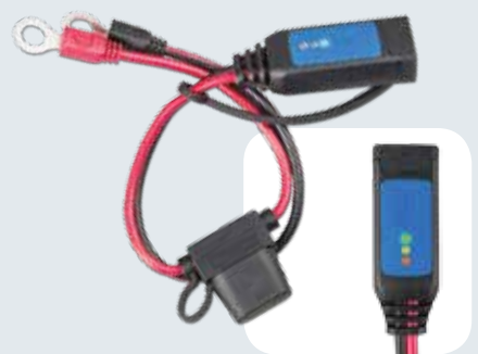
Accu indicator oogjes M8