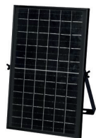
Monocrystal Solar Panel