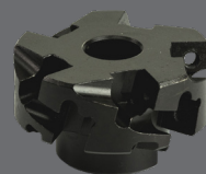
Freeskop Code: B60.0027