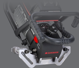
RVS geleideplaten Code: B60.1020S