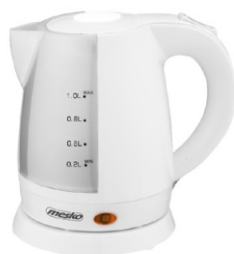
electric kettle MS 1276