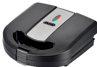
Sandwich Maker MS 3045