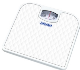
Bathroom scale MS 8160