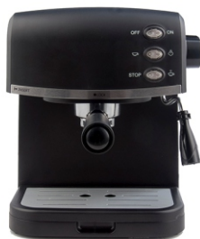
Espresso Maker MS 4409