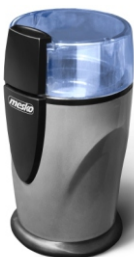
Coffee Grinder MS 4465