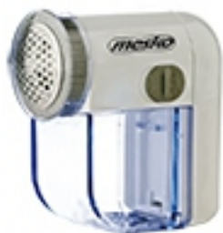
Lint remover MS 9610