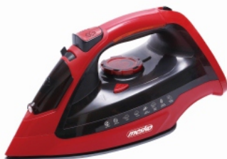
Steam Iron MS 5031