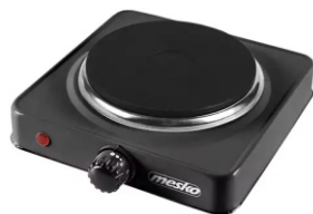
Hot Plate MS 6508