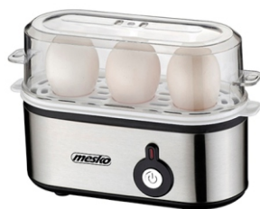
Egg Boiler MS 4485