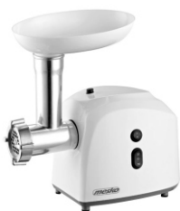
meat grinder MS 4805