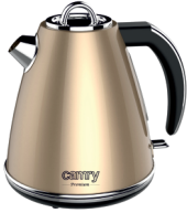
ELECTRIC KETTLE CR 1292