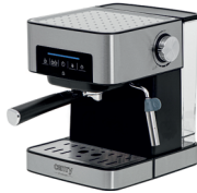
ESPRESSO MACHINE CR 4410