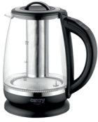
ELECTRIC KETTLE CR 1290