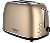
TOASTER 2 SLICES CR 3217