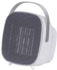
CERAMIC FAN HEATER CR 7732