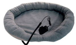
HEATED ANIMAL DEN CR 7431