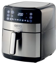
AIR FRYER OVEN CR 6311