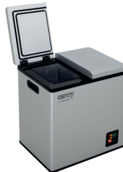
PORTABLE FRIDGE CR 8076