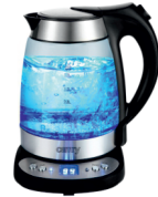
ELECTRIC GRILL CR 3044