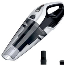
BAGLESS VACUUM CLEANER CR 7046