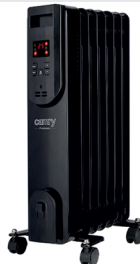
OIL FILLED RADIATOR CR 7812