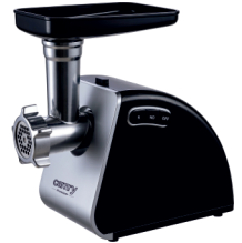
MEAT MINCER CR 4812