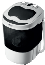
WASHING MACHINE CR 8054