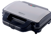
SANDWICH MAKER CR 3054