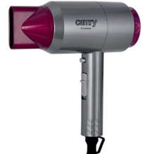
HAIR DRYER CR 2256