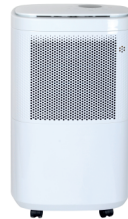
AIR DEHUMIDIFIER CR 7851