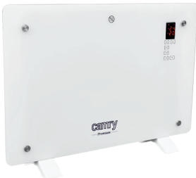
GLASS HEATER CR 7721