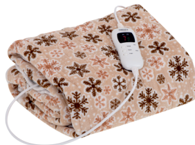
HEATING UNDERBLANKET CR 7430