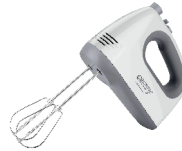
MIXER CR 4220