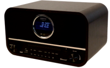
RETRO RADIO CR 1182