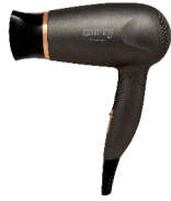
HAIR DRYER CR 2261