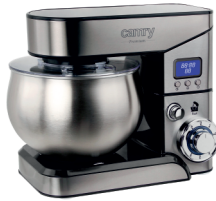
FOOD PROCESSOR CR 4223