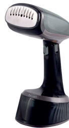
GARMENT STEAMER CR 5033