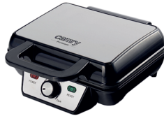
WAFFLE MAKER CR 3046