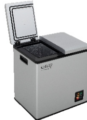
PORTABLE FRIDGE CR 8076