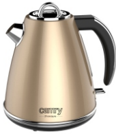
ELECTRIC KETTLE CR 1292