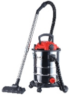
VACUUM CLEANER CR 7045