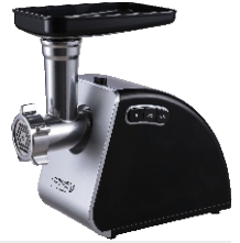
MEAT MINCER CR 4812