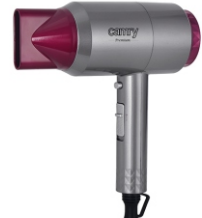
HAIR DRYER CR 2256