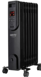
OIL FILLED RADIATOR CR 7812