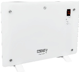
GLASS HEATER CR 7721