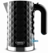
Electric Kettle CR 1169