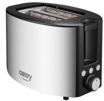
TOASTER 2 SLICES CR 3215