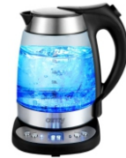
ELECTRIC GRILL CR 3044