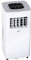
AIR CONDITIONER CR 7926