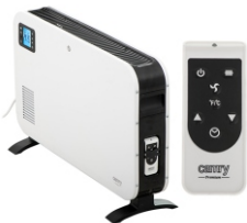
CONVECTION HEATER CR 7724