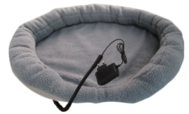
HEATED ANIMAL DEN CR 7431