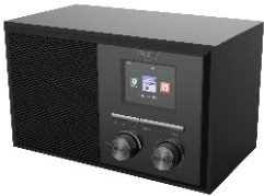
INTERNET RADIO CR 1180