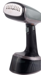
GARMENT STEAMER CR 5033