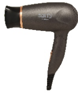
HAIR DRYER CR 2261