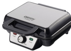
WAFFLE MAKER CR 3046