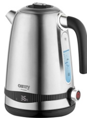
ELECTRIC KETTLE CR 1291