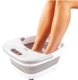
FOOT SPA CR 2174