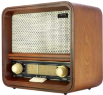
RETRO RADIO CR 1188