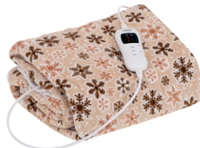
HEATING UNDERBLANKET CR 7430