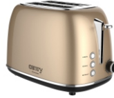
TOASTER 2 SLICES CR 3217