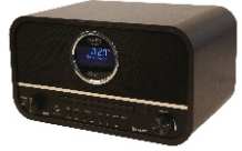
RETRO RADIO CR 1182