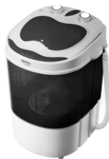
WASHING MACHINE CR 8054