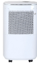
AIR DEHUMIDIFIER CR 7851