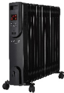
OIL FILLED RADIATOR CR 7814