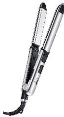
HAIR STRAIGHTENER CR 2320