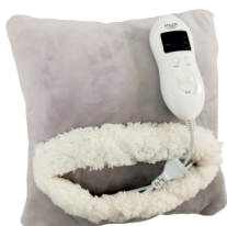
HEATED PAD AD 7412