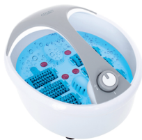
FOOT SPA AD 2177