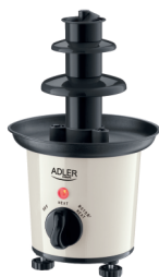
CHOCOLATE FOUNTAIN AD 4487