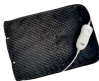
HEATED PAD AD 7433