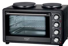
Electric Oven With HOB AD 6020