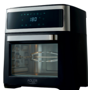
AIR FRYER OVEN AD 6309