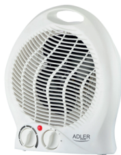
FAN HEATER AD 7728