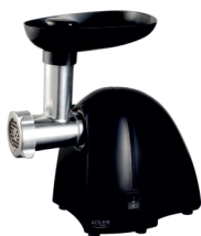
MEAT MINCER AD 4811