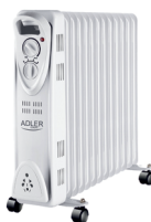
OIL-FILLER RADIATOR AD 7811