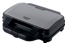
SANDWICH MAKER AD 3043