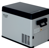
PORTABLE FRIDGE AD 8077