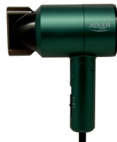
HAIR DRYER AD 2265