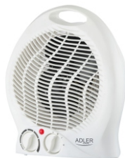
FAN HEATER AD 7728