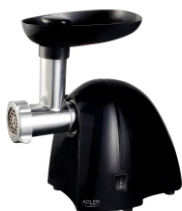
MEAT MINCER AD 4811