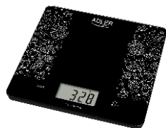
KITCHEN SCALE AD 3171