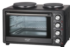
Electric Oven With HOB AD 6020