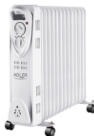
OIL-FILLER RADIATOR AD 7811