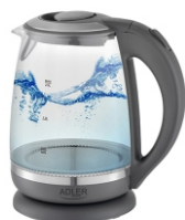
ELECTRIC KETTLE AD 1286