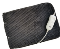
HEATED PAD AD 7433