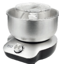
MIXER WITH BOWL AD 4222