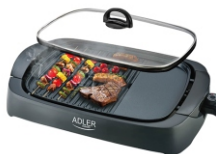
ELECTRIC GRILL AD 6610