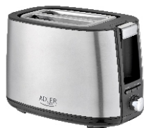
TOASTER 2 SLICE AD 3214