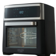
AIR FRYER OVEN AD 6309