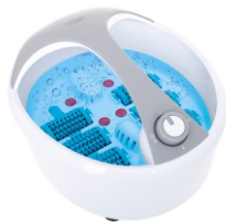
FOOT SPA AD 2177