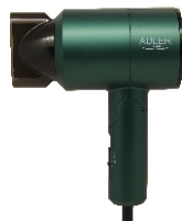
HAIR DRYER AD 2265