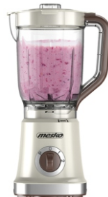
BLENDER WITH JAR MS 4079