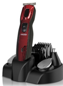
TRIMMER SET MS 2931