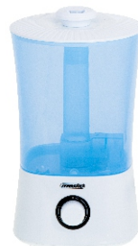
AIR HUMIDIFIER MS 7965