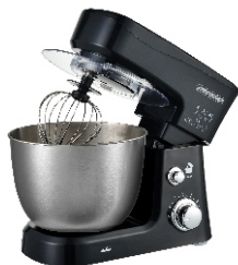
MIXER WITH BOWL MS 4217