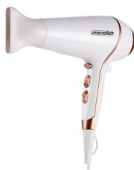
HAIR DRYER MS 2250