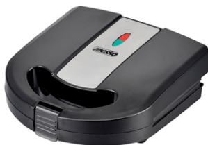
SANDWICH MAKER 3IN1 MS 3045