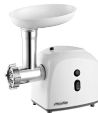
MEAT MINCER MS 4805