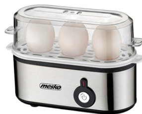
Egg Boiler MS 4485