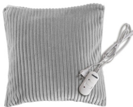
HEATED PAD MS 7429