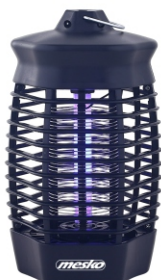
MOSQUITO KILLER LAMP MS 7933