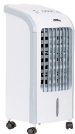
AIR COOLER MS 7914