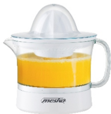
CITRUS JUICER MS 4010