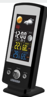
Weather Station MS 1177