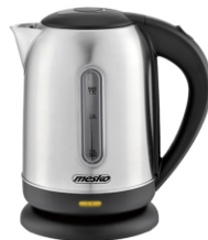
ELECTRIC KETTLE MS 1288