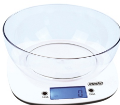
KITCHEN SCALE MS 3165