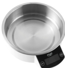
Kitchen Scale AD 8121