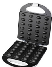
Nut Cookie Maker AD 3039