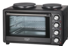
Electric Oven With HOB AD 6020