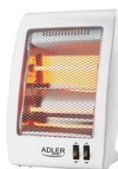
Quartz Heater AD 7709