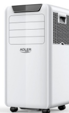
Air Conditioner AD 7916