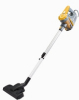
Bagless Vacuum AD 7036