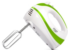
Mixer AD 4205