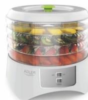
Food dryer AD 6654