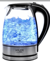
Electric Kettle AD 1225