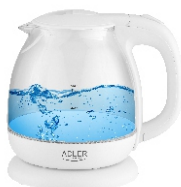
Water Kettle 1,0L AD 1283