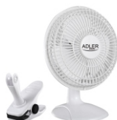
Desk fan 15 cm with clip AD 7317