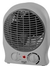
Fan Heater AD 7717