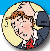
W.A., zoon van overledene