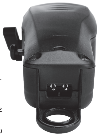
illustration n° 1

Η κουρευτική μηχανή θα φορτιστεί με πιο αργό ρυθμό ενώ χρησιμοποιείται με το καλώδιο συνδεδεμένο.