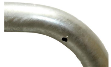
Fietsbeugel met tussenbuis Arceau à vélo avec barre transversale