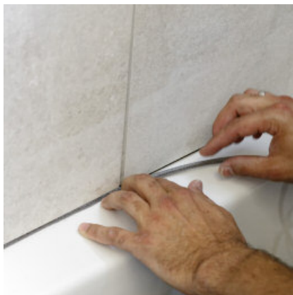
Eventueel zwelband en dan siliconenkit aanbrengen.