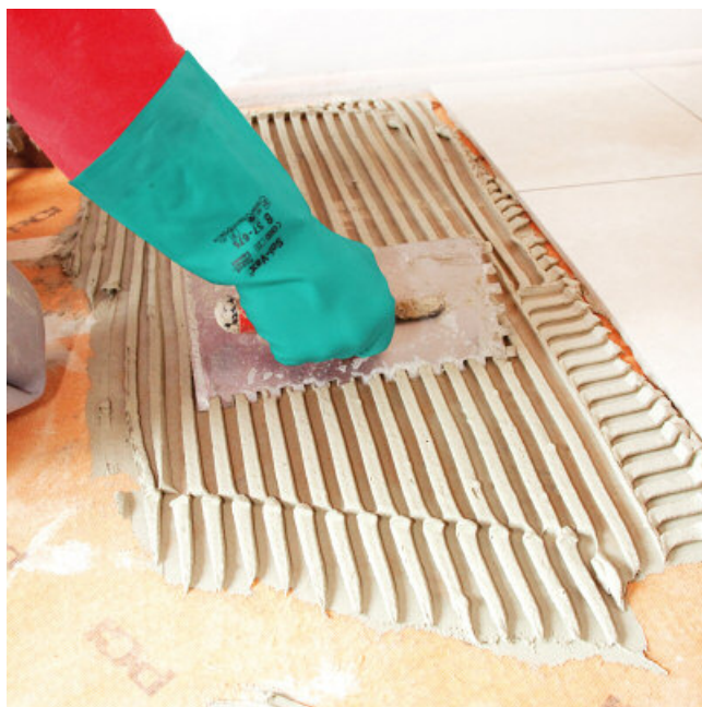
En met PCI FLEXMÖRTEL S1 FLOTT de tegels verlijmen.