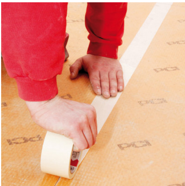
In droge ruimtes de stootkanten met afplakband afplakken, in natte ruimtes met PCI PECITAPE.