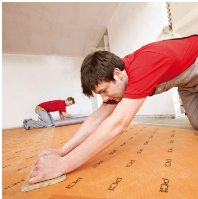
PCI PECILASTIC U neerleggen en aandrukken, bijvoorbeeld met een houten plank of voegbord van hard rubber.