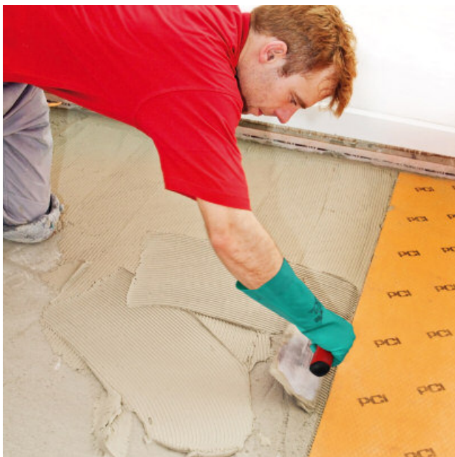
Op de voorbereide ondergrond PCI FLEXMÖRTEL S1 FLOTT opkammen.

Om het restvocht onder de stroken PCI PECILASTIC U te kunnen afvoeren, mogen de randen, randvoegen en plinten niet worden afgekit.