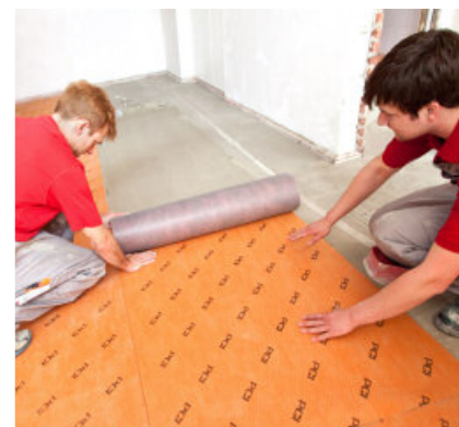
Keramiek kan op de afdichtings- en ontkoppelingsmat PCI Pecilastic U eenvoudig aangebracht worden.