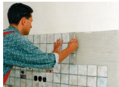
De tegels glijden niet weg en de positie kan nog enige tijd gecorrigeerd worden.