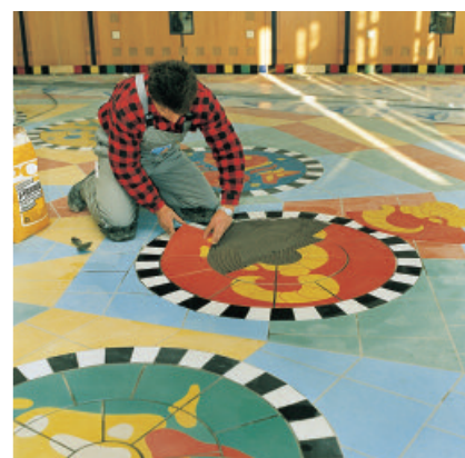
Een goede verlijming met PCI Flexmörtel.