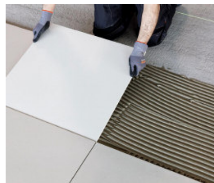
Het lijmen van tegels met lage wateropname.