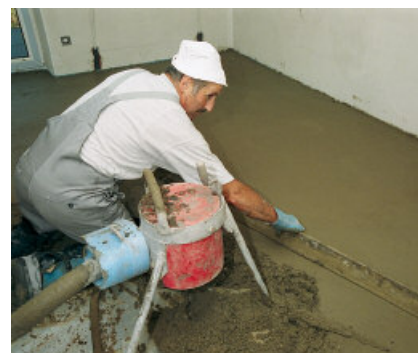
Cementdekvloeren met als toevoeging PCI Novoment Z1 zijn al na ca. 3 uur beloopbaar en al na ca. 1 dag kan keramiek worden verlijmd.