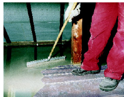
Vezelversterkte PCI Periplan Extra is zeer geschikt voor renovatie bij het egaliseren op vloeren van hout en spaanplaten.