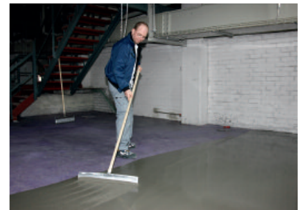
Met PCI Periplan Multi wordt een snel belastbare vloeregalisatielaag aangebracht