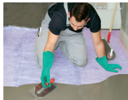
Een geschikte PCI-egalisatiemortel wordt op de uitgerolde glasvezelmat PCI Armiermatte GFM gegoten en met een spaan verdeeld (minimale laagdikte 5 mm).