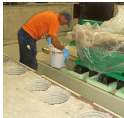
Aangieten van een machineverankering met PCI Repaflow Plus