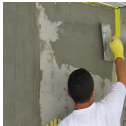
PCI Barrafill L bij cosmetische reparatie aan betonnen constructies.