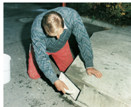
PCI Repafix besitzt eine hohe Standfestigkeit und ist deshalb bestens geeignet für Reprofilier- und Modellierarbeiten bei Kantenausbrüchen.