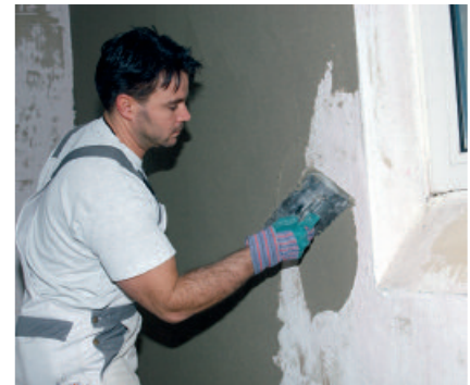
PCI Pericret is smeug en gemakkelijk te verwerken in een laagdikte van 3 tot 50 mm.