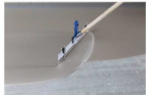
PCI FT Plan overtuigt dankzij een zeer goed verloop en een glad oppervlak