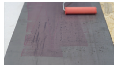
METAAL Keragrip Eco