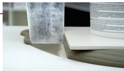
Geen afname van dikte

“ Ik had genoeg van dikke mengsels om tegels te ondersteunen. Met Biogel ® No Limits ® heb ik een nieuwe thixotrope en vloeibare consistentie ervaren waarmee ik beter en zekerder kan werken. ”