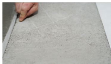
CEMENTDEKVLOEREN hardheid en reiniging controleren