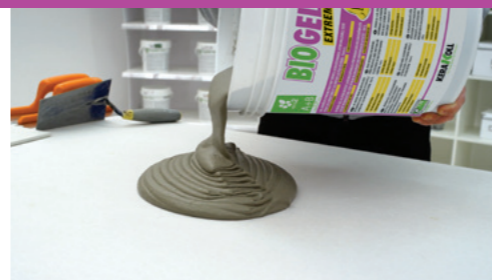
Thixotroop en vloeibaar mengsel

Biogel ® No Limits ® is thixotroop in alle dikten, vloeïend en licht. Ook op wanden moeiteloos werken en zonder dat de tegel zakt.