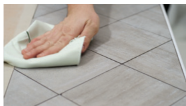
KERAMIEK reinigen en drogen