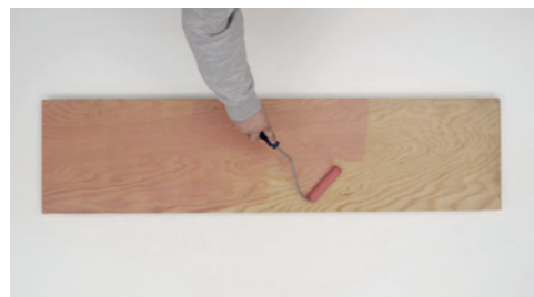
Keragrip Eco klaarmaken