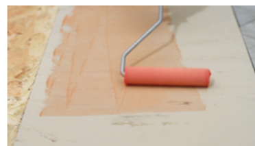
PVC Keragrip Eco