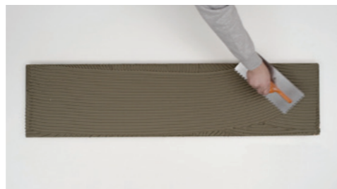
Biogel ® aanbrengen