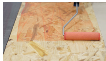
HOUT Keragrip Eco