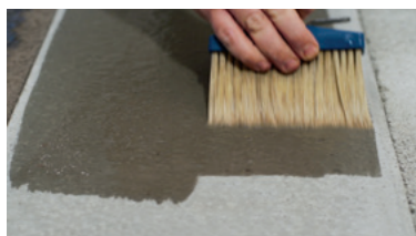
BETON absorptie controleren