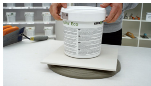
Ondersteunt de tegel