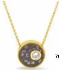
709 Y/W/R Gold €299 / $419 / £269