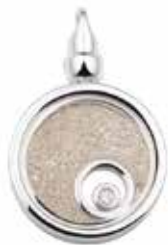
102 S Silver Glass Front and Back €299 / $375 / £269