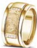
RY 004 14kt Yellow Gold + RY 005 Sider Diamonds & Fingerprint €1745 / $2085 / £1575