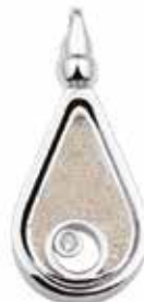
104 S Silver Glass Front and Back €325 / $409 / £290