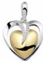
110 SB Silver Silver / Gold-plated Zircons / Open back €299 / $375 / £269