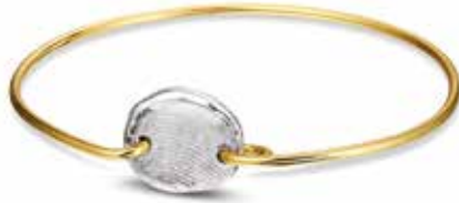
406 SG Silver Yellow Gold Band €525 / $659 / £469