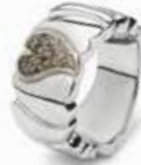
RG 006 Silver Heart