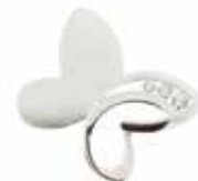
RL 005 Silver Zircon €119 / $169 / £109