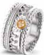
ROR 004 S Silver 11 mm €249 / $325 / £224