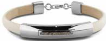
BL 012 Silver / Leather 9 mm / Ashes €229 / $320 / £229