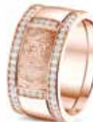
RR 004 14kt Rose Gold + RR 006 Sider Diamonds & Fingerprint €2485 / $2885 / £2345