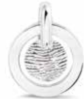
401 SP Silver Fingerprint Also holds ashes €199 / $279 / £179