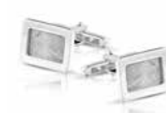
423 S Cufflinks / Rectangle Two different fingerprints €395