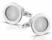
422 S Cufflinks / Round Two different fingerprints €395