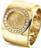
RY 007F 14kt Yellow Gold Diamonds & Fingerprint €3095 / $3495 / £2795