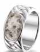
ROR 008 S Silver 9 mm €225 / $315 / £199 ■ EU: 17 t/m 22 USA: 6½ to 12¾ UK: M½ to Z