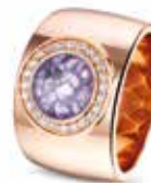
RR 007 14kt Rose Gold Diamonds €2950 / $3395 / £2675