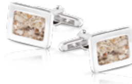
RL 008 SC Cufflinks / Rectangle €195 / $270 / £195