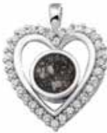
124 SVO Silver Open Front €249 / $299 / £224