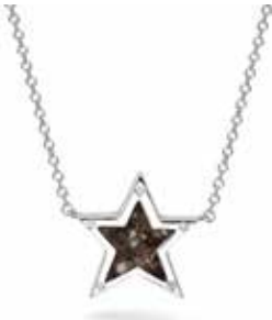
604 S Silver €159 / $199 / £139