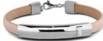
BL 013 Silver / Leather 9 mm / Ashes €229 / $320 / £229