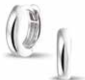
304 SE Silver Earring / 12 mm €49 / $69 / £45