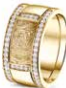
RY 004 14kt Yellow Gold + RY 006 Sider Diamonds & Fingerprint €2485 / $2885 / £2345