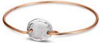
406 SR Silver Rose Gold Band €525 / $659 / £469