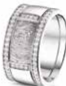
RW 004 14kt White Gold + RW 006 Sider Diamonds & Fingerprint €2485 / $2885 / £2345