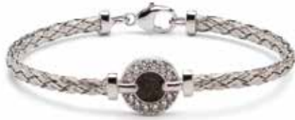
BL 001 Silver €249 / $339 / £225