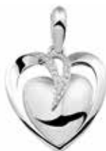
110 S Silver Zircons / Open back €279 / $349 / £249