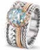
ROR 003 R Silver 14kt Rose Gold 10.5 mm €795 / $895 / £715