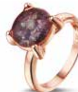
RR 002 14kt Rose Gold €995 / $1159 / £895