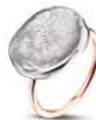
407 SR Silver Rose Gold Band €325 / $410 / £289