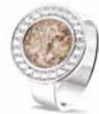
RG 045 Silver Zircon €225 / $310 / £199 ■