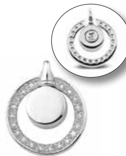
108 SDI Silver Silver Front €325 / $409 / £290