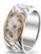
ROR 008 Y Silver 14kt Yellow Gold 9 mm €299 / $375 / £269