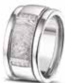
RW 004 14kt White Gold + RW 005 Sider Diamonds & Fingerprint €1745 / $2085 / £1575