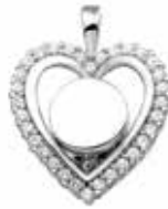
124 SVD Silver Silver Front €249 / $299 / £224