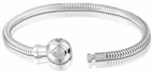
811 S Silver Bracelet 16 cm €79 / $110 / £79