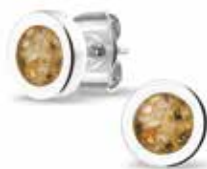
301 SE Silver Ear Stud €85 / $119 / £77