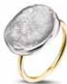
407 SG Silver Yellow Gold Band €325 / $410 / £289