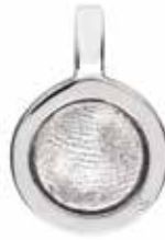
403 S Silver Fingerprint (Laser only) €225 / $260 / £199