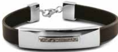
BG 009 Silver / Leather 13 mm €249 / $345 / £249