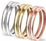
RW 005 14kt White Gold RY 005 14kt Yellow Gold RR 005 14kt Rose Gold Siders Sleek (Pair) €650 / $790 / £590 per pair

Available and priced separately, sold as pairs or individually. Not meant to hold ash remains.