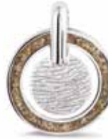
401 SA Silver Fingerprint Also holds ashes €225 / $299 / £205