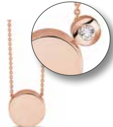
704 Y/W/R Gold €299 / $419 / £269