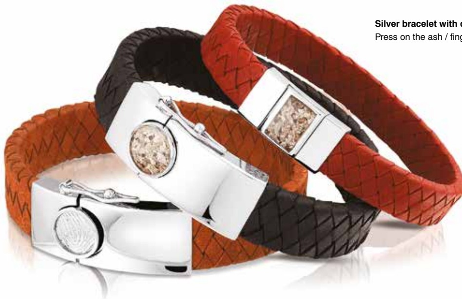
Silver bracelet with double braided leather Press on the ash / fingerprint to open the lock.

BG 007 and BG 008 have straps available in black, navy, brown, cognac, and camel.