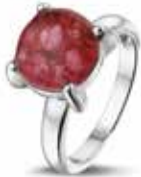
RW 002 14kt White Gold €995 / $1159 / £895