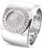
RW 007F 14kt White Gold Diamonds & Fingerprint €3095 / $3495 / £2795