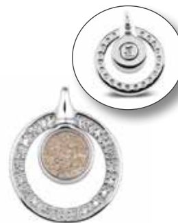
108 SGL Silver Glass Front €325 / $409 / £290