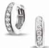
305 SE Silver Earring Zircon / 12 mm €69 / $98 / £63