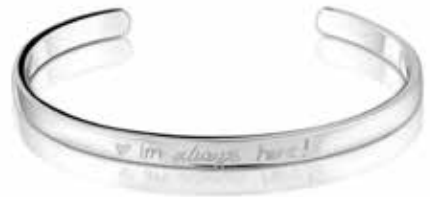
420 S / 57 mm Bracelet Engraving excluded / See page 51 €189 / $265 / £189