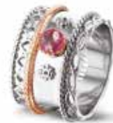
ROR 006 R Silver 14kt Rose Gold 13.5 mm €495 / $575 / £445