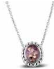
132 S Silver Chain included 40 – 45 cm €169 / $235 / £169