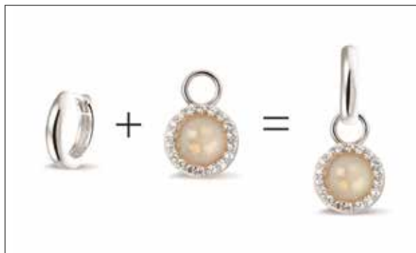
306 SE Silver Earring / 14 mm €59 / $83 / £54