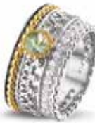
ROR 005 Y Silver 14kt Yellow Gold 11.5 mm €595 / $695 / £535