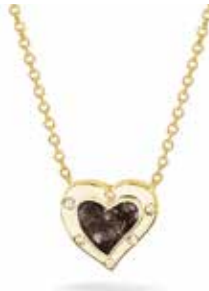
605 SG Yellow-plated €169 / $209 / £149