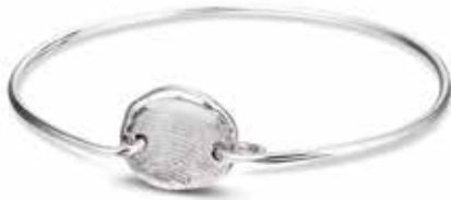
406 S Silver Silver Bracelet €199 / $269 / £179