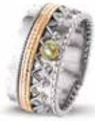
ROR 002 R Silver 14kt Rose Gold 10.3 mm €490 / $575 / £440