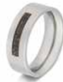
RS 006 Steel 8 mm / 0.31 inch €155 / $219 / £139 ■ EU: 17 t/m 22 USA: 6½ to 12¾ UK: M½ to Z