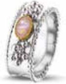
ROR 001 Y Silver 14kt Yellow Gold 8 mm €275 / $325 / £249