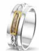
ROR 010 Silver 14kt Yellow Gold 7 mm €299 / $375 / £269

EU: 17 t/m 22 USA: 6½ to 12¾ UK: M½ to Z