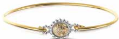
ROB 002 Y Silver 14kt Yellow Gold €575 / $795 / £525