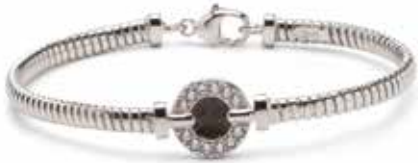
BL 004 Silver €225 / $319 / £199