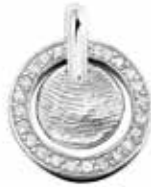
401 SZ Silver / Zirconia Fingerprint €235 / $315 / £210