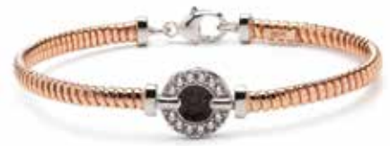
BL 006 Silver Rose-plated €225 / $319 / £199