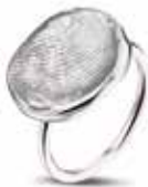
407 S Silver Silver Ring €149 / $199 / £134