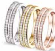
RW 006 14kt White Gold RY 006 14kt Yellow Gold RR 006 14kt Rose Gold Siders Diamonds (Pair) €1390 / $1590 / £1250 per pair