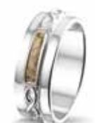
ROR 010 S Silver 7 mm €225 / $315 / £199 ■ EU: 17 t/m 22 USA: 6½ to 12¾ UK: M½ to Z