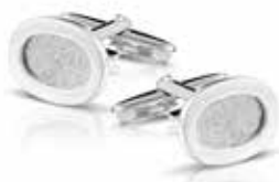
421 S Cufflinks / Oval Two different fingerprints €395