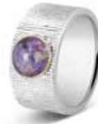
223 SY Silver / Gold 10 mm €295 / $410 / £295