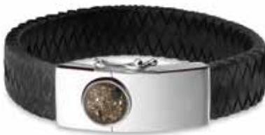
BG 007 Silver / Leather 17 mm With Ash €2989 / $299 / £225