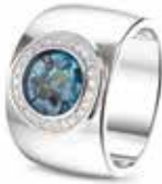
RW 007 14kt White Gold Diamonds €2950 / $3395 / £2675