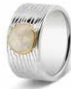
226 SY Silver / Gold 10 mm €295 / $410 / £295