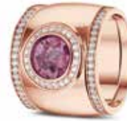
RR 007 14kt Rose Gold + RW 006 Siders Diamonds €4340 / $4985 / £3925