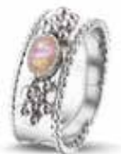
ROR 001 S Silver 8 mm €175 / $229 / £159