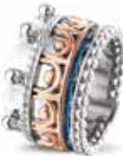
ROR 007 R Silver 14kt Rose Gold 14 mm €895 / $995 / £799