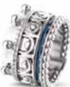
ROR 007 S Silver 14 mm €249 / $325 / £224