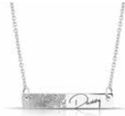
417 S Silver Horizontal bar / Chain included Engraving excluded / See page 51 €89 / $125 / £89