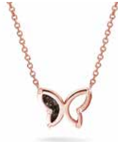
606 SR Rose-plated €169 / $209 / £149