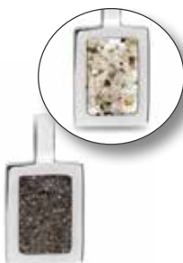
RL 008 Silver Open Front €149 / $199 / £134