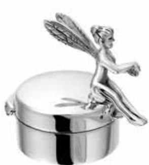
501 SF Silver Mini Urn Fairy - 19 mm / 0.75 inch €125 / $175 / £115

A collection of Candle-Urns and Mini-Urns with visible ashes, available with custom engraving.