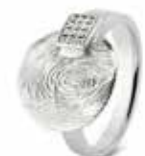
413 S Silver Ring / Zircons Engraving excluded / See page 51 €195 / $270 / £195