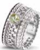
ROR 005 S Silver 11.5 mm €269 / $349 / £242