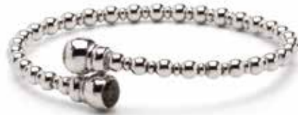
BL 007 Silver €199 / $279 / £179