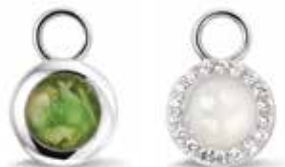
308 SE Silver Ear Pendant / Round €99 / $139 / £89