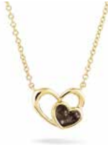
602 SG Yellow-plated €169 / $209 / £149