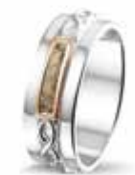
ROR 010 Silver 14kt Rose Gold 7 mm €299 / $375 / £269

EU: 17 t/m 22 USA: 6½ to 12¾ UK: M½ to Z