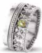
ROR 002 S Silver 10.3 mm €195 / $255 / £179