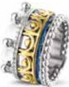
ROR 007 Y Silver 14kt Yellow Gold 14 mm €895 / $995 / £799