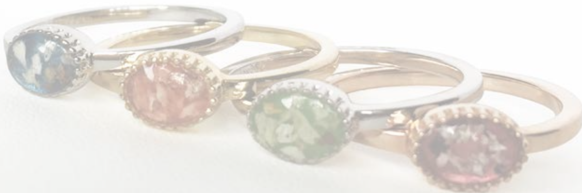
RWS 004 Silver + RG 026 Sider Zircons & Fingerprint €473 / $587 / £413