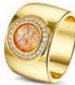
RY 007 14kt Yellow Gold Diamonds €2950 / $3395 / £2675