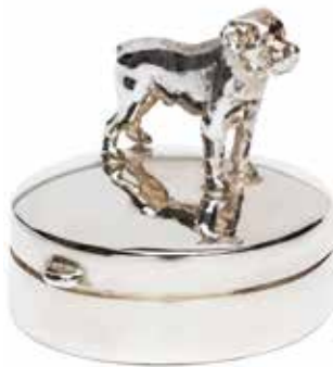
506 SB Silver Mini Urn Dog Large - 30 mm / 1.18 inch €255 / $349 / £229