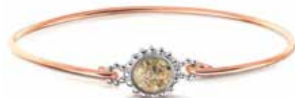
ROB 002 R Silver 14kt Rose Gold €575 / $795 / £525