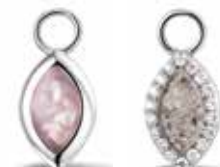
310 SE Silver Ear Pendant / Marquise €99 / $139 / £89