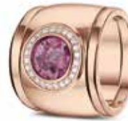
RR 007 14kt Rose Gold + RR 005 Siders Diamonds €3600 / $4975 / £3265