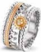
ROR 004 R Silver 14kt Rose Gold 11 mm €695 / $795 / £625