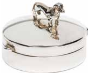
505 SS Silver Mini Urn Dog Small - 30 mm / 1.18 inch €225 / $315 / £199