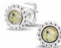
303 SE Silver Ear Stud / Balls €85 / $119 / £77