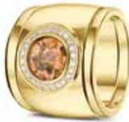
RY 007 14kt Yellow Gold + RY 005 Siders Diamonds €3600 / $4975 / £3265