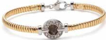
BL 005 Silver Yellow-plated €225 / $319 / £199