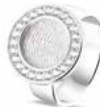
410 S Silver Fingerprint (Laser only) €325 / $410 / £289

EU: 16 t/m 20 USA: 5½ to 10¼ UK: K to U½