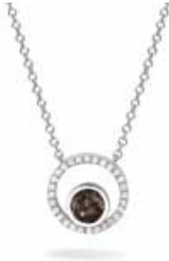
601 S Silver €169 / $219 / £149