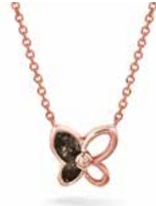
603 SR Rose-plated €169 / $209 / £149