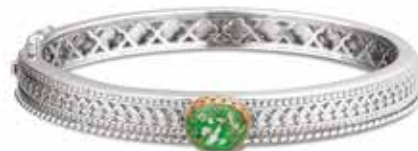
ROB 001 R Silver 14kt Rose Gold 58 mm / 60 mm / 62 mm €759 / $995 / £683