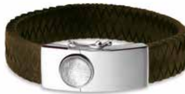
BG 007 F Silver / Leather 17 mm With Fingerprint €399 / $559 / £359