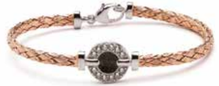
BL 003 Silver Rose-plated €249 / $339 / £225