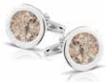
RL 007 SC Cufflinks / Round €195 / $270 / £195