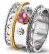
ROR 006 Y Silver 14kt Yellow Gold 13.5 mm €495 / $575 / £445