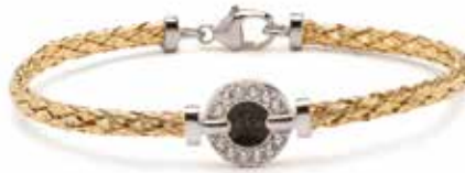
BL 002 Silver Yellow-plated €249 / $339 / £225