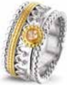
ROR 004 Y Silver 14kt Yellow Gold 11 mm €695 / $795 / £625