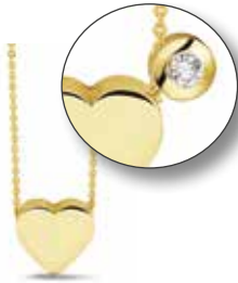
701 Y/W/R Gold €299 / $419 / £269