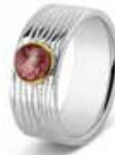
225 SY Silver / Gold 8 mm €275 / $385 / £275