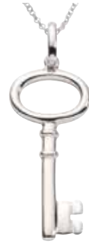
RL 012 Silver Chain Included €139 / $195 / £125