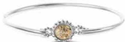
ROB 002 S Silver €175 / $245 / £175