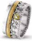
ROR 002 Y Silver 14kt Yellow Gold 10.3 mm €490 / $575 / £440