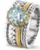
ROR 003 Y Silver 14kt Yellow Gold 10.5 mm €795 / $895 / £715