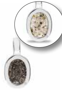
RL 006 Silver Open Front €149 / $199 / £134