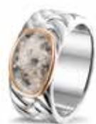
ROR 008 R Silver 14kt Rose Gold 9 mm €299 / $375 / £269