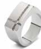
RS 011 Steel 10 mm / 0.39 inch €139 / $179 / £129 ■ EU: 17½ t/m 22 USA: 7¼ to 12¾ UK: O to Z