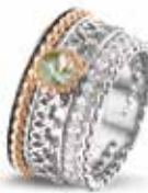
ROR 005 R Silver 14kt Rose Gold 11.5 mm €595 / $695 / £535