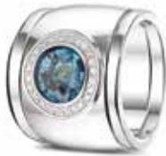
RW 007 14kt White Gold + RW 005 Siders Diamonds €3600 / $4975 / £3265