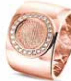
RR 007F 14kt Rose Gold Diamonds & Fingerprint €3095 / $3495 / £2795