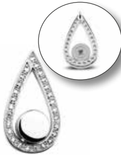
109 S Silver Silver €325 / $409 / £290