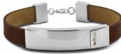
BG 010 Silver / Leather 13 mm €249 / $345 / £249