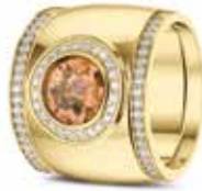
RY 007 14kt Yellow Gold + RW 006 Siders Diamonds €4340 / $4985 / £3925