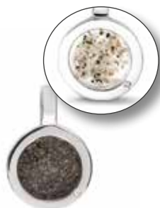
RL 007 Silver Open Front €149 / $199 / £134