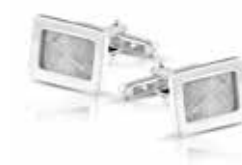
423 S Cufflinks / Rectangle Two identical fingerprints €295 / $410 / £295