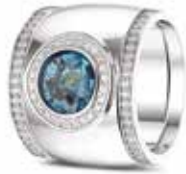
RW 007 14kt White Gold + RW 006 Siders Diamonds €4340 / $4985 / £3925