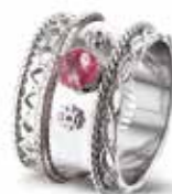
ROR 006 S Silver 13.5 mm €239 / $310 / £219