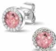
302 SE Silver Ear Stud / Zircon €99 / $139 / £89