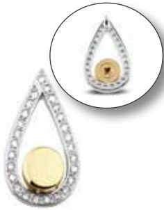
109 SG Silver Silver / Gold-plated €345 / $439 / £310