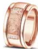
RR 004 14kt Rose Gold + RR 005 Sider Diamonds & Fingerprint €1745 / $2085 / £1575