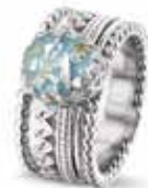
ROR 003 S Silver 10.5 mm €259 / $339 / £235