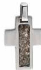
RL 010 Silver Open Front €179 / $227 / £159