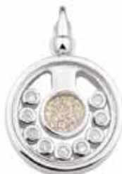
103 S Silver Glass Front and Back €325 / $409 / £290