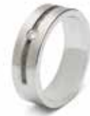
RS 007 Steel / Zircon 6 mm / 0.24 inch €119 / $155 / £99 ■ EU: 16 t/m 20 USA: 5½ to 9¼ UK: K to U½