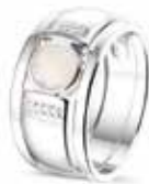
RG 022 with RG 026 Siders €198 / $307 / £189 ■