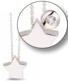
702 Y/W/R Gold €299 / $419 / £269