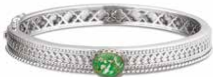
ROB 001 S Silver 58 mm / 60 mm / 62 mm €395 / $515 / £355