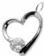
RL 001 Silver* Zircon €79 / $109 / £72