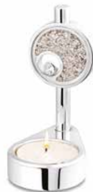
110 A Candle Urn with Glass RVS 100 mm / 45 mm / 75 mm 3.9 inch / 1.7 inch / 3.0 inch €225 / $273 / £210