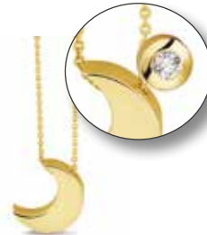
703 Y/W/R Gold €299 / $419 / £269