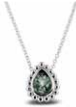
131 S Silver Chain included 40 – 45 cm €169 / $235 / £169