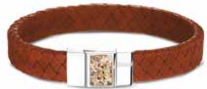
BG 008 Silver / Leather With Ash €229 / $319 / £229