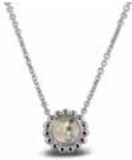
130 S Silver Chain included 40 – 45 cm €169 / $235 / £169