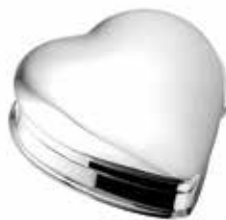
503 S Silver Mini Urn Heart Large - 28 mm / 1.10 inch €165 / $229 / £149