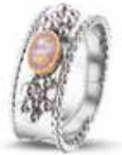
ROR 001 R Silver 14kt Rose Gold 8 mm €275 / $325 / £249