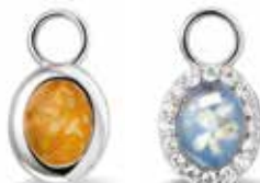
309 SE Silver Ear Pendant / Oval €99 / $139 / £89