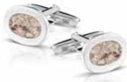
RL 006 SC Cufflinks / Oval €195 / $270 / £195