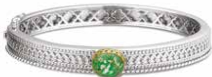
ROB 001 Y Silver 14kt Yellow Gold 58 mm / 60 mm / 62 mm €759 / $995 / £683