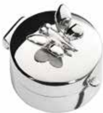
501 SV Silver Mini Urn Butterfly - 19 mm / 0.75 inch €125 / $175 / £115