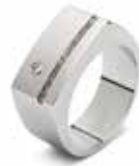
RS 010 Steel 9 mm / 0.35 inch €139 / $179 / £129 ■ EU: 17½ t/m 22 USA: 7¼ to 12¾ UK: O to Z