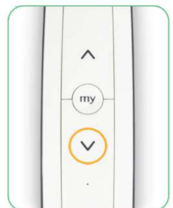
Druk op knop Omlaag

Je herkent dat de RS100 IO motor klaar is, zodra deze boven + beneden softclose sluit. Dit is namelijk een unieke eigenschap van de RS100 IO.