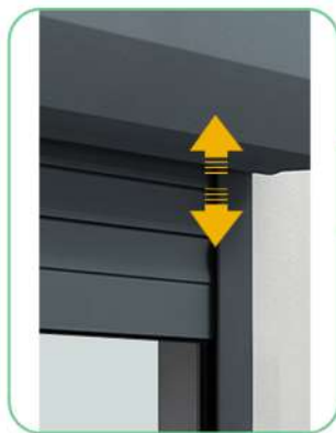
1 x Korte beweging