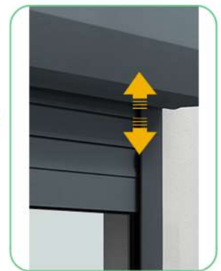
1 x Korte beweging