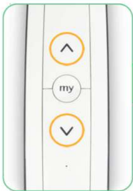
Druk op de knoppen Omhoog + Omlaag

* Indien je een meer kanaals afstandsbediening hebt selecteer je vooraf eerst je gewenste kanaal.