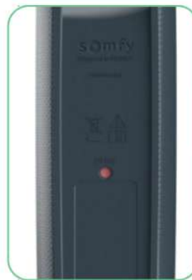
Druk op de PROG knop