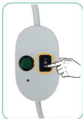
Druk op de knop Omlaag

Neem de afstelkabel bij de hand. We gaan nu eerst de motor resetten. Dit doen we door het knopje rechtsonder ingedrukt te houden totdat het rolluik 2 x korte beweging heeft gegeven. Na de 2 x korte beweging laat je de knop los. De volgende stap is de draairichting controleren. Druk op de knop naar beneden. Loopt de motor naar beneden? Dan kun je verder met het programmeren. Loopt de motor naar boven? Dan is de draairichting niet juist en dien je de bruin/zwart kabel om te draaien.