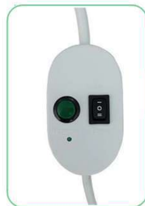
Laat de groene knop los. De positie beneden is nu afgesteld