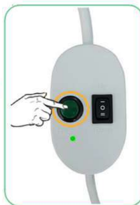
Druk de groene knop in totdat gewenste positie beneden is bereikt