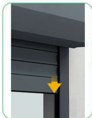
Het rolluik zal naar beneden bewegen