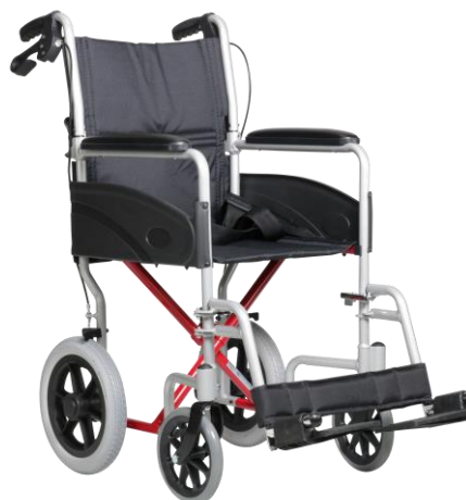
De getoonde productfoto kan afwijken van de standaard configuratie.