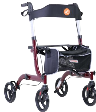
De getoonde productfoto kan afwijken van de standaard configuratie.