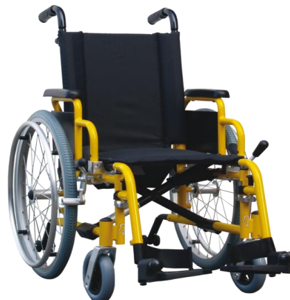
De getoonde productfoto kan afwijken van de standaard configuratie.