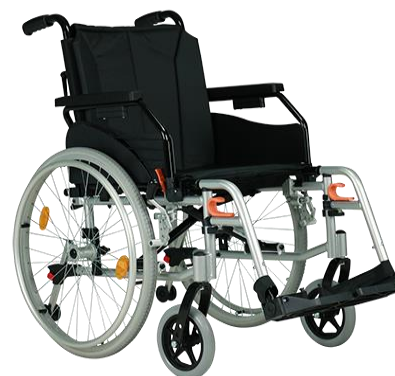
De getoonde productfoto kan afwijken van de standaard configuratie.

Let op: zithoogte 45 cm is uitsluitend mogelijk in combinatie met 6" voorwielen en 22" achterwielen.