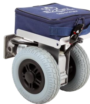
De getoonde productfoto kan afwijken van de standaard configuratie.

Let op: de actieradius is volgens opgave van de fabrikant, gemeten onder ideale omstandigheden met een testgewicht van 75 kg, met aangepaste snelheid van 6 km/u en een temperatuur van 20 graden Celcius in een klinische omgeving. Van invloed kunnen zijn: gebruikersgewicht, weersomstandigheden, snelheid, bandendruk, wegomstandigheden, conditie van de accu's en het wel of niet heuvelachtige landschap.