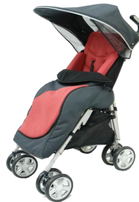
De getoonde productfoto kan afwijken van de standaard configuratie.