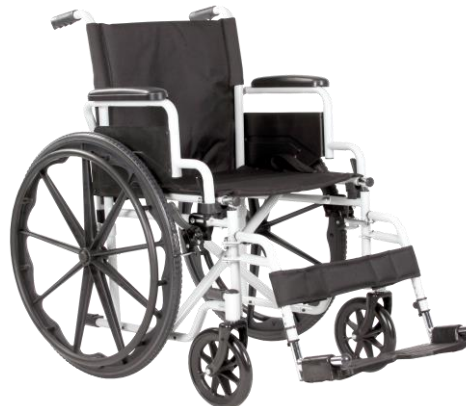
De getoonde productfoto kan afwijken van de standaard configuratie.