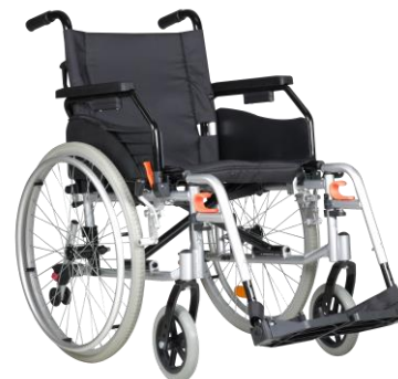
De getoonde productfoto kan afwijken van de standaard configuratie.