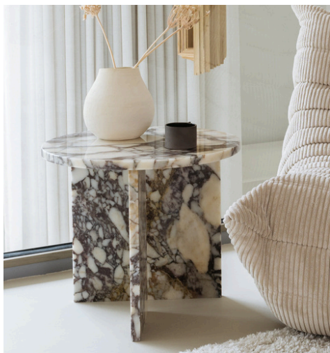
Italiaans Calacatta Viola marmer, tafel June