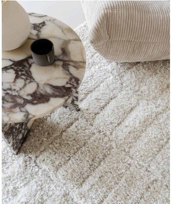
Wollen vloerkleed Stella

Onze wollen kleden zijn ontworpen om rust, tactiliteit en warmte toe te voegen aan interieurs. Elk vloerkleed wordt ambachtelijk geweven in een traditionele wolweverij in België - speciaal of op maat voor jou - van zuivere wol; puur, zacht, duurzaam.