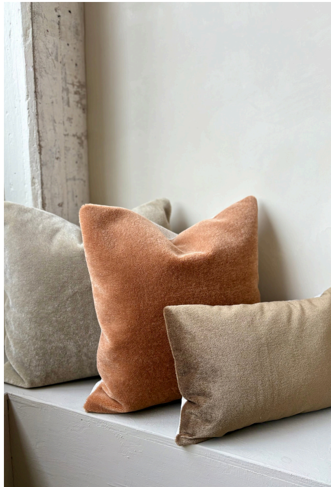
Mohair sierkussens: natuurlijk, zacht, pure luxe.