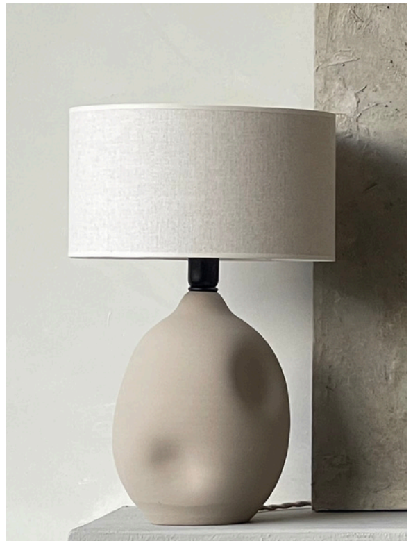
Tafellamp Liz met aardewerken voet en linnen kap