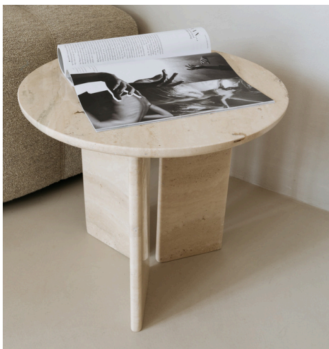
Spaans Travertin, tafel Jade

Onze studio-items zijn ontworpen als sculpturen voor een interieur: zachte, pure vormen waarin het materiaal altijd de hoofdrol speelt. De vorm blijft dezelfde, maar het karakter verandert mee met de steen. Zo krijgt ieder object een eigen persoonlijkheid, terwijl de signatuur van Studio Femme Home herkenbaar blijft.