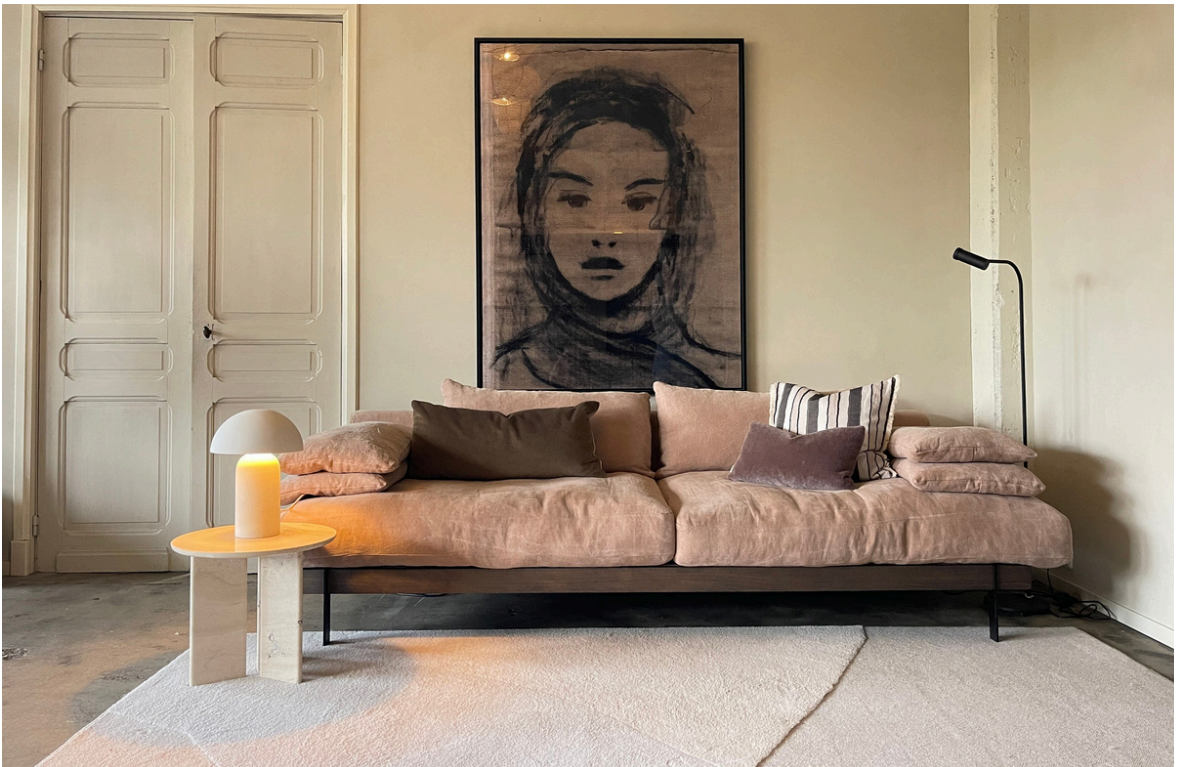
Wollen vloerkleed Rose