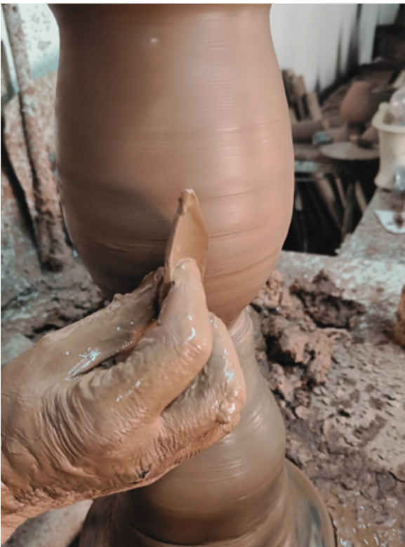
De voet van tafellamp Liz wordt in Portugal ambachtelijk handgedraaid, van terracotta

Ons met de hand gedraaide keramiek komt uit een klein atelier in Portugal. Ieder product wordt hier met zorg en liefde vervaardigd, door traditionele vakmensen. Dit ambachtelijk handwerk zie je in de verfijnde vormen en lijnen van onze producten. Allemaal uniek en uitzonderlijk mooi.