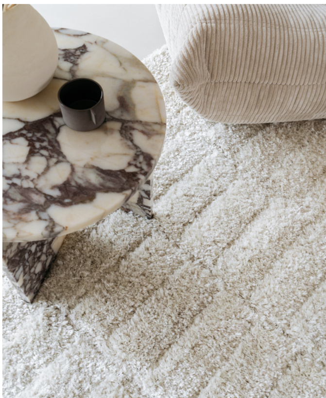
Wollen vloerkleed Stella

Onze wollen kleden zijn ontworpen om rust, tactiliteit en warmte toe te voegen aan interieurs. Elk vloerkleed wordt ambachtelijk geweven in een traditionele wolweverij in België - speciaal of op maat voor jou - van zuivere wol; puur, zacht, duurzaam.