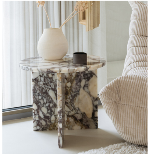
Italiaans Calacatta Viola marmer, tafel June