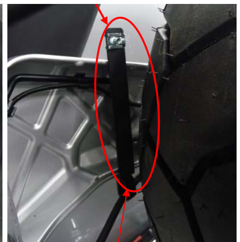
Position de la vis BHc 5×15