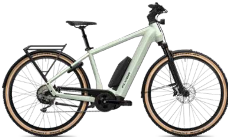
7.12 XC Gents, Frosty Sage Gloss, met tweede accu