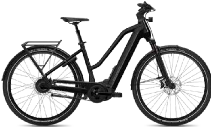
7.43 Mixed, Pearl Black Gloss