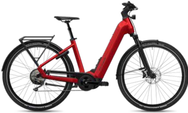
7.10 Comfort, Pulse Red Gloss