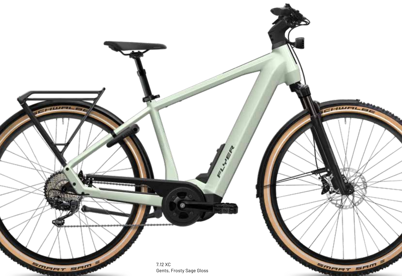
7.12 XC Gents, Frosty Sage Gloss

naar wens in te stellen. De krachtige motor met royale accu en optionele range extender maakt nieuwe actieradiusrecords mogelijk. De FLYER stuurpen zorgt voor een bijzonder strakke uitstraling, doordat de kabels direct in het frame zijn verwerkt. De Upstreet is verkrijgbaar in drie verschillende frametypen en drie kleurvarianten. Daarnaast zijn er speciale uitvoeringen met XC-banden voor meer grip en met een verende zadelpen voor langere tochten buiten de gebaande paden.