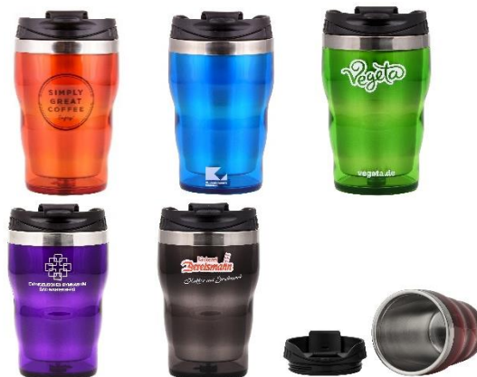
(Abbildungen sind Produkt-Beispiele)